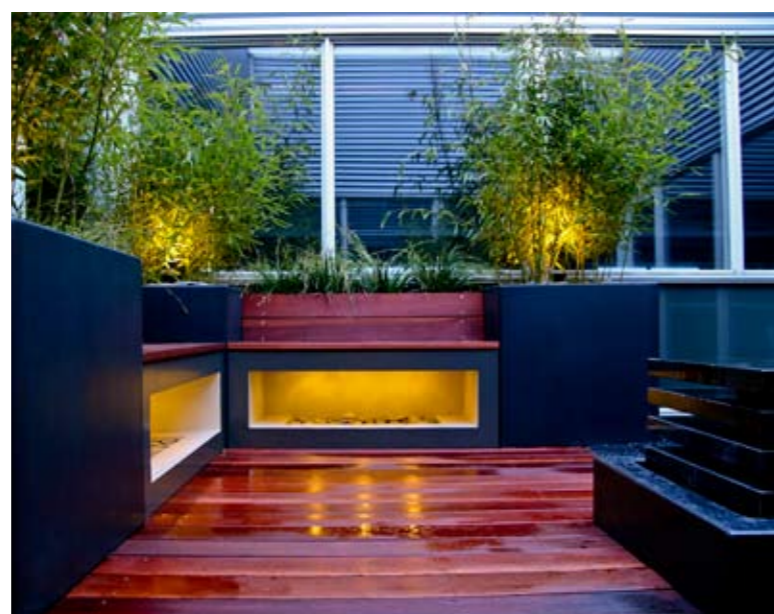
Door de ledverlichting worden de banken 's avonds prachtige blikvangers. En grondspots tussen de beach pebbles lichten de bamboe 's avonds mooi aan.