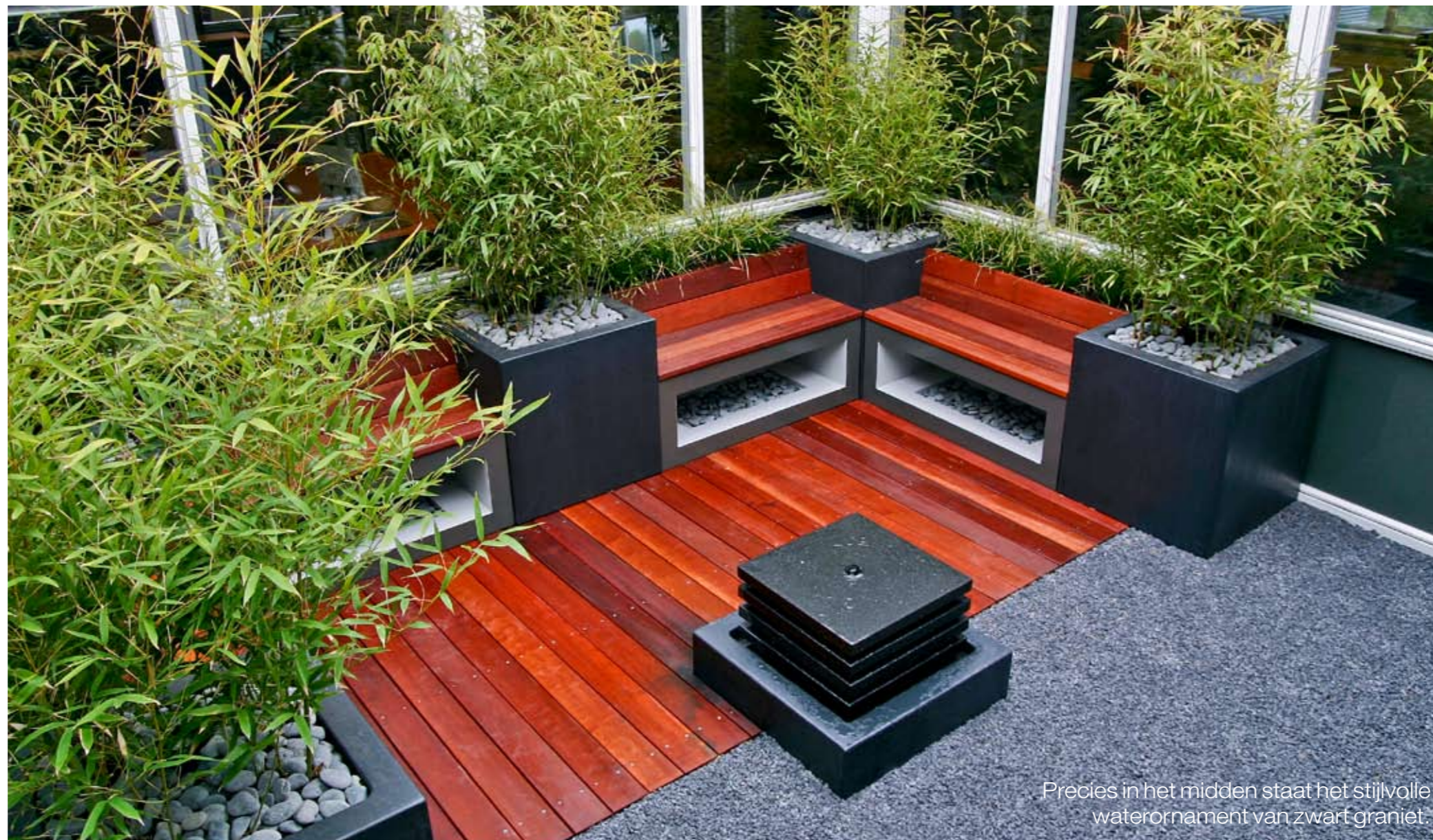
Precies in het midden staat het stijlvolle waterornament van zwart graniet.

Alles in deze patio-tuin klopt. Ook over de kleuren van de ruimte onder de bank is goed nagedacht. „De binnenkant is in een lichte kleur geschilderd, de buitenkant in een donkere. Dit vormt een mooi contrast waardoor de bank beter uit komt“, aldus de ontwerper. De warme bruinrode kleur van het Massaranduba hardhout contrasteert weer mooi met het antraciet van de bakken. In deze bakken staat de wintergroene bamboe Phyllostachys aurea . Achter de banken staat het bontbladige siergras Carex morrowii 'Variegata' dat eveneens groenblijvend is. Erik van Gelder: „Beide soorten kunnen goed tegen aanplant in bakken en geven massa aan de beplanting. Er is hier weinig ruimte voor beplanting en dan moet deze wel groen ogen. Om toch volume te houden is daarom van de bamboe niet de hele onderkant kaal geknipt.“